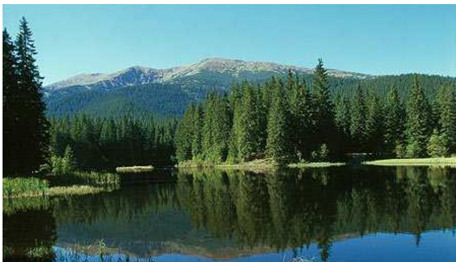
Nízké Tatry: Vrbické pleso