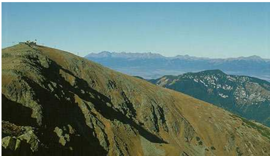
Nízké Tatry: Chopok (2023,6 m n.m.), druhý nejvyšší vrchol

Fauna a flóra této části Západních Karpat je velice bohatá. Potkat tady můžete jak medvěda, tak vlka či rysa, kočku divokou, ale i kamzíka a sviště.